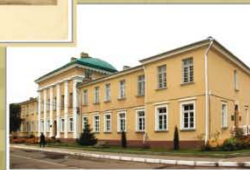
Будынак на плошчы Свабоды, 4

Выданне Камітэта па будаўніцтву 2-й пачатковай школы, Валожын. Друкарня «Ротат», Варшава