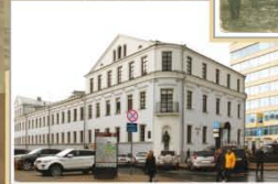
Будынак на плошчы Свабоды, 13. Пачатак XXI ст.