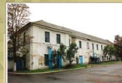
Былы корпус Маладзечанскай настаўніцкай семінарыі, побач з якім стаяў касцёл (сёння — тэрыторыя станкабудаўнічага завода). 2016 г.