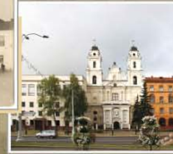
Плошча Свабоды і Рэспубліканская гімназія-каледж пры Беларускай дзяржаўнай акадэміі музыкі. Пачатак XXI ст.