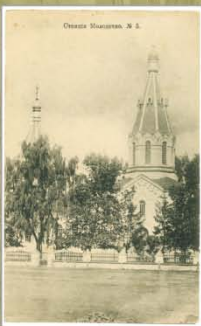
Пакроўская царква. 1916 г. Выдавецтва Контрагентства А.С. Суворына і К°, Масква