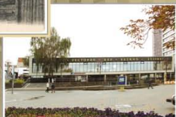
Проспект Пераможцаў. Будынак газастацыі «Юбілейная». Пачатак XXI ст.