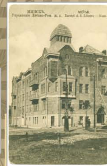
Упраўленне Лібава-Роменскай чыгункі. 1911—1917 гг. Выдавецтва А.І. Фіялкоў, Вільня