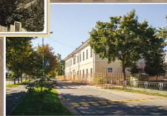
Гімназія № 1 г. Слуцка. 2016 г.