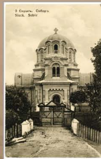
Свята-Мікалаеўскі сабор. 1902–1917 гг. Видаетства А.І. Фіалкі, Вільня