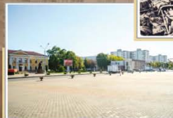
Гарадская плошча. Пачатак ХХІ ст.