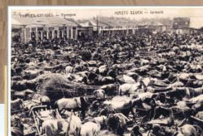
Кірмаш. Пачатак XX ст. Видаетства «Faban & С», Браслаў