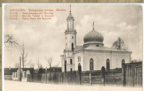
Татарская вуліца. Мячэць. Пачатак XX ст. Выдавецтва Д.П. Ефімава, Масква