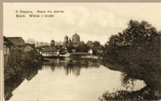
Від з моста. 1902–1917 гг. Фото С.Л. Южина, Слуцк. Видаетства А.І. Фіалкі, Вільня