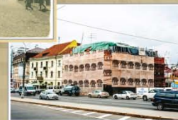
Вуліца Гарадскі Вал, на рэканструкцыі — будынак пажарнай часткі №1 з музеем пажарнай і аварыйна-ратавальнай справы. 2016 г.