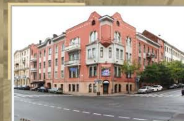
Будынак на вуліцы Кірава, 11. 2016 г.