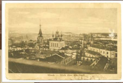
Мінск. Від на горад. 1918 г. Выдавецтва «Voedecker», Берлін

Выстава прысвечана штогадовай акцыі – Дням Еўрапейскай спадчыны ў Беларусі