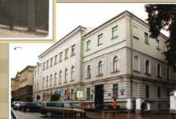
Нацыянальны гістарычны музей Рэспублікі Беларусь. Пачатак XXI ст.