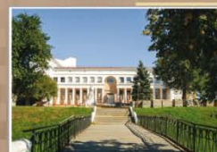
Дом культуры. 2016 г.