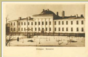
Будынак староства. 1932 г.

Выданне Камітэта па будаўніцтву 2-й пачатковай школы, Валожын. Друкарня «Ротат», Варшава