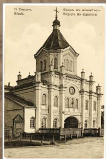
Надбрамная Свята-Івана-Багаслоўская царква Свята-Троіцкага мужчынскага манастыра. 1902–1917 гг. Видаетства А.І. Фіалкі, Вільня