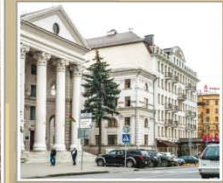
Гасцініца «Еўропа». 2016 г.