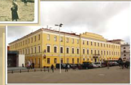
Будынак на плошчы Свабоды, 23. Пачатак XXI ст.