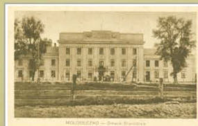
Будынак староства. 1921–1931 гг. Выданне Кааператыва, Маладзечна. Друкарня Св. Войцэха, Познань