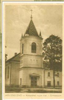
Касцёл Св. Казіміра і гімназія. 1921–1930 гг. Выданне Кааператыва, Маладзечна. Друкарня Св. Войцэха, Познань