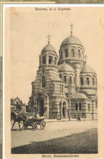
Свята-Казанская (чыгуначная) царква. 1914—1917 гг. Выдавецтва Е. Каплана, Мінск