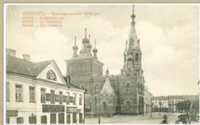
Мінск. Кафедральны сабор. Пачатак XX ст. Выдавецтва Д.П. Ефімава, Масква