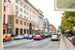
Вуліца Леніна. Пачатак XXI ст.