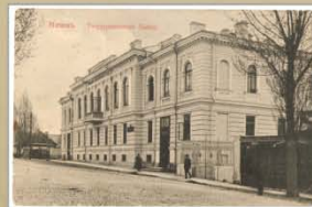
Дзяржаўны банк. Пачатак XX ст. Выдадніе Л. Разаўскага