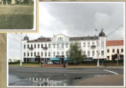
Будынак на плошчы Свабоды, 4. Пачатак XXI ст.