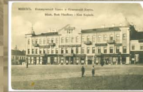
Камерцыйны банк і Купецкі клуб. Пачатак XX ст.