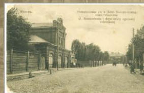
Раманаўская вуліца і дапо Вольна-пажарнага таварыства. Пачатак XX ст. Выдавецтва А.І. Фіялкоў, Вільня