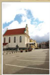
Концэртная зала «Верхні горад». Пачатак XXI ст.