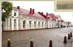
Чыгуначны вакзал. 2016 г.