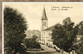
Шырокая вуліца. 1902–1917 гг. Видаетства А.І. Фіалкі, Вільня