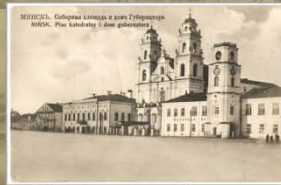
Саборная плошча і дом губернатара. Пачатак XX ст.