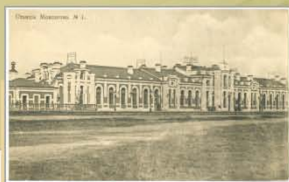
Станцыя Маладзечна. 1916 г. Выдавецтва Контрагентства А.С. Суворына і К°, Масква