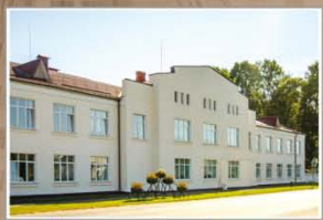
Слуцкі дзяржаўны медыцынскі каледж. 2016 г.