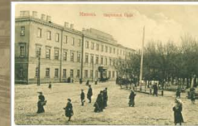
Акруговы суд. Пачатак XX ст.