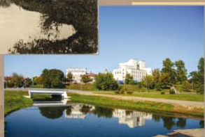
Від з моста. 2016 г.