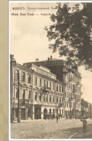
Руска-Азіяцкі банк. 1913–1917 гг. Выдавецтва А.І. Фіялкі, Вільня