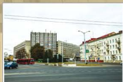
Плошча Маснікова. 2016 г.